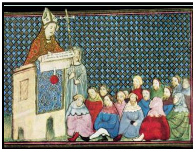
Illuminura (Século XI) ilustrando missa aos peregrinos

A Igreja se apercebeu logo do bom negócio que era esse negócio de peregrinações; resolveu regulamentá-las, estabelecendo rituais conexos: após vencer a distância, o peregrino devia primeiro confessar-se, depois cumprir a penitência imposta (freqüentemente amenizada pelo tamanho da esmola anexada), depois assistir uma missa com liturgia específica e sermão apropriado, depois comungar. E pronto! Estava limpo!!!