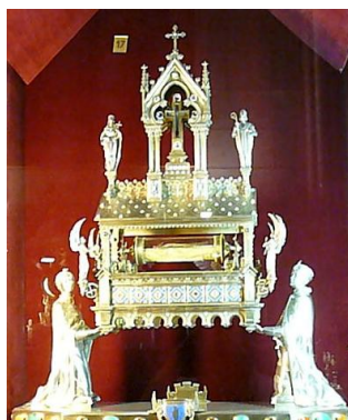
As vestes de Maria em Aachen, a Coluna em Roma, e fragmento da cruz em Paris