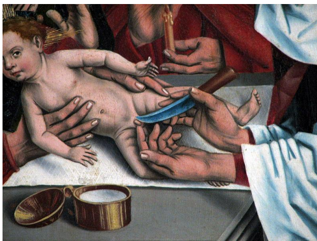
"A circuncisão do menino Jesus" (anônimo flamengo)

uma das mais veneradas relíquias "de primeira classe" (assim são referidas aquelas que foram "do próprio", como um pé, um osso, um chumaço de cabelos, um frasco do seu sangue etc; as "de segunda classe" são as que foram "usadas", como uma roupa, um cajado etc); essa a que me refiro agora é de "primeríssima, pois era de um judeuzinho que foi chamado de Jesus, e que conforme a lei e o costume de sua gente, foi circuncidado no templo no seu décimo dia de vida: