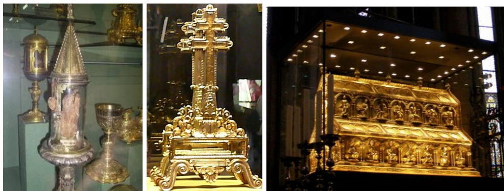
O pé do Santo Inácio de Antioquia; um dos cravos que pregaram Jesus na cruz; o relicário dos Reis Magos (notinha sobre esta última relíquia: se diz que a Catedral de Colônia ficou incólume ao bombardeio da aviação aliada, na 2ª Guerra Mundial, por causa dela - os reis magos desviavam as bombas? - veja-se uma foto de Colônia bombardeada a seguir)