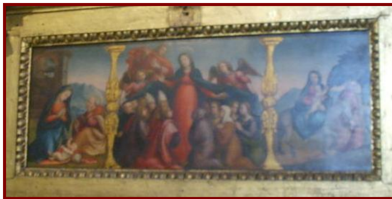
Madonna della Misericórdia (Ghirlandaio, 1515) Firenze, Museo del Bigallo: O Quadro estava na capela da Misericórdia (no prédio 1); agora está no Museu, ao lado da Irmandade