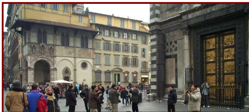
Na fotografia se vê, da esquerda para a direita: o Museo Del Bigallo, o Prédio 1 da Misericórdia, e o Batistério (na face que tem a porta de Lorenzo Ghiberti, a "Porta Del Paradiso" atraindo os fotógrafos japoneses):

A Misericórdia de Florença (1244) situa-se na região mais central da cidade, na Piazza San Giovanni (que os florentinos chamam de Piazza del Duomo, já que aí está a Igreja de Santa Maria dei Fiori, e que os nativos chamam de Il Duomo). É na praça, à esquerda da igreja (se ficarmos de costas para sua fachada), bem ao lado do Batistério. Encostado ao prédio da Misericórdia está o pequeno Museo Del Bigallo, onde estão reunidas e guardadas as obras de arte que ficavam no interior da Misericórdia.