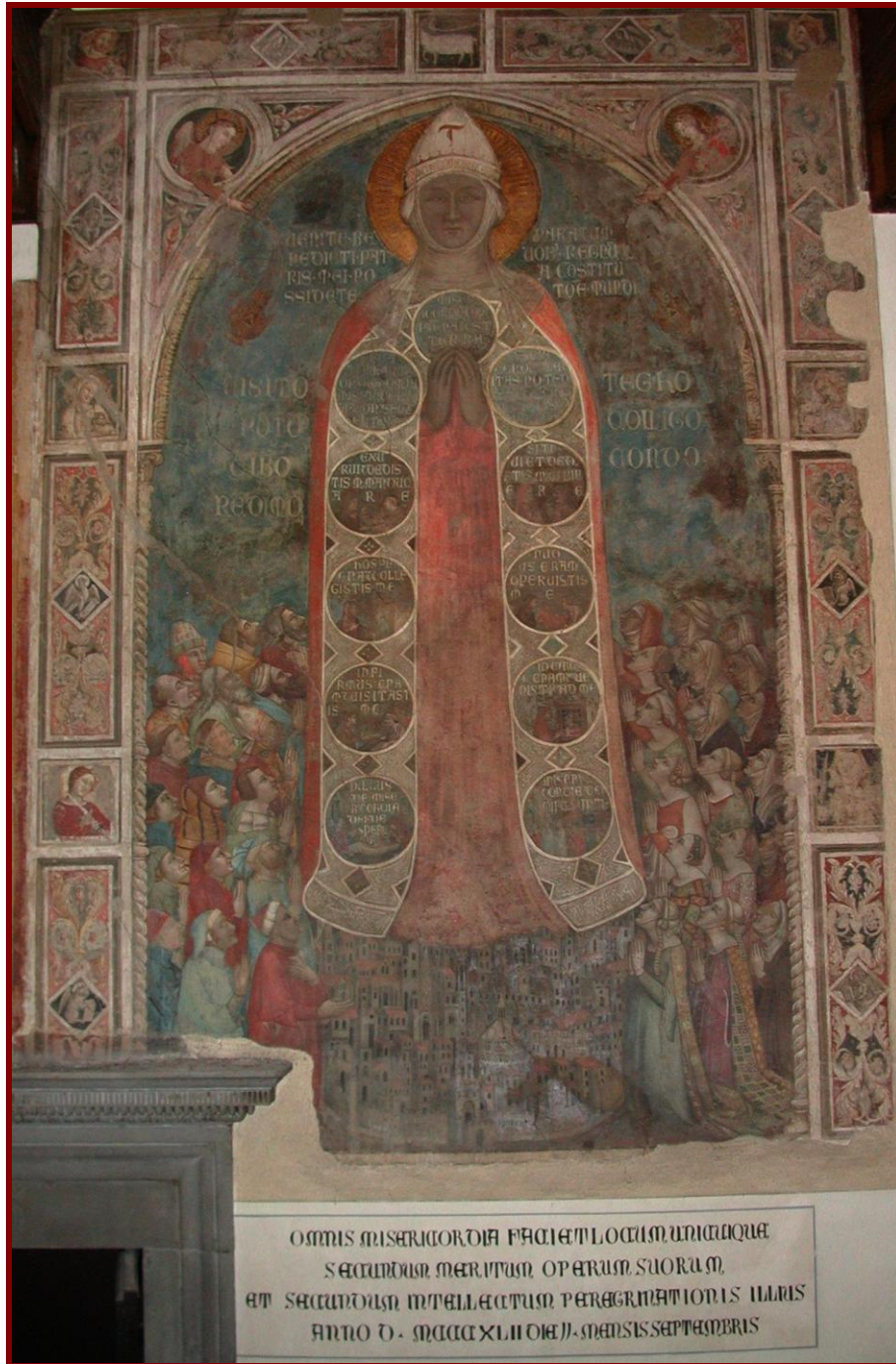
A pintura está perfeitamente datada: Ano do Senhor: 1342, dia 11 do mês de setembro

A seguir, apresento documento importante sobre a Misericórdia de Florença. Que também estava no prédio 1 da Misericórdia e foi transferido para o Museu do Bigallo. Trata-se de pintura de Bernardo Daddi (aluno de Giotto di Bondone), datada de 11 de Setembro de 1342, e traduz a visão do pintor sobre Nossa Senhora da Misericórdia, com exaltações sobre as obras da Confraria apresentadas em discos que decoram o manto protetor de Maria com texto e figura correspondentes: