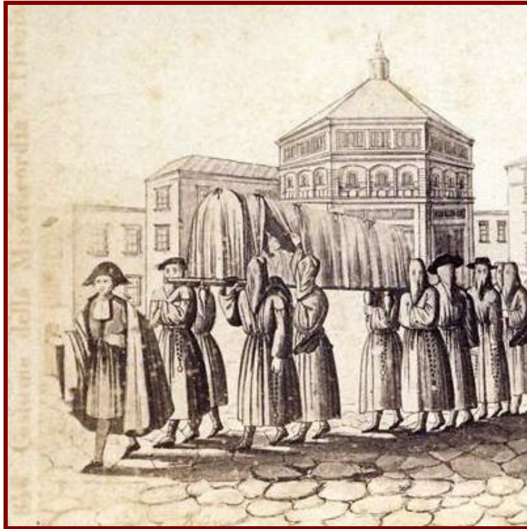
Pormenor do cartão de Sommer: observar o Batistério da Piazza Del Duomo de Florença, ao lado do qual está o prédio da Misericórdia. Na ilustração (com cena de uma das obras da Misericórdia: enterrar os mortos) se vê que os membros da Irmandade estão encapuzados com o líder à frente: o "Provedor", ou o "Provveditore")