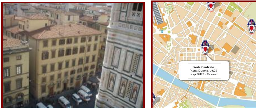
Olhado do alto da cúpula do Duomo, o prédio 2 da Misericórdia,

d) Há ainda um montão de texto a mais na pintura de Daddi, mas isso é o que mais me interessa, pois reitera a minha posição de que a Padroeira da Misericórdia é a Nossa Senhora da Misericórdia, e não a Nossa Senhora da Piedade, conforme opinião de uns e outros.