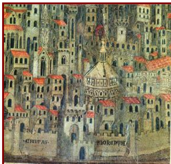
Localização da Misericórdia de Florença

Esta ilustração (com mais explicitações a respeito a seguir) é a mais antiga (1342) que aponta o prédio da Misericórdia na cidade; centrando a ilustração está o octogonal Batistério; na base da ilustração se vê a antiga muralha da cidade; do lado esquerdo da muralha se lê "CARITAS"; à direita eleva-se um prédio branco; o "Caritas" indica os fundos do prédio da Misericórdia, e o prédio branco é o atual museu do Bigallo (o arco de entrada do museu atual era um dos arcos de entrada na muralha)